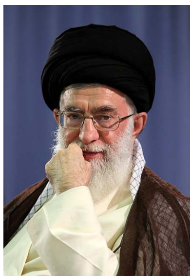
کارگران پایه‌ها و استوانه‌های